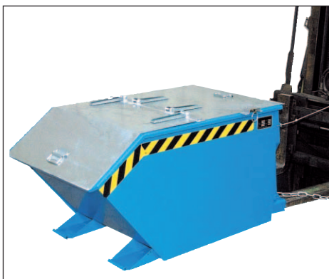
Typ GU mit Deckel