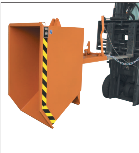
Typ GU in Kippstellung