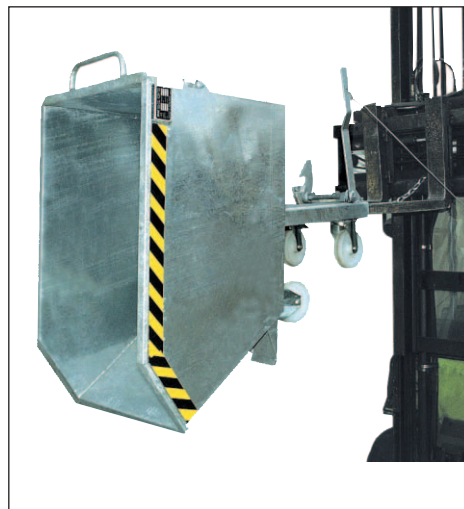
Typ GU verzinkt, mit Rollen