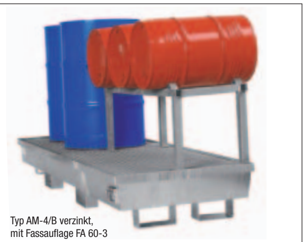
Typ AM-4/B verzinkt, mit Fassauflage FA 60-3