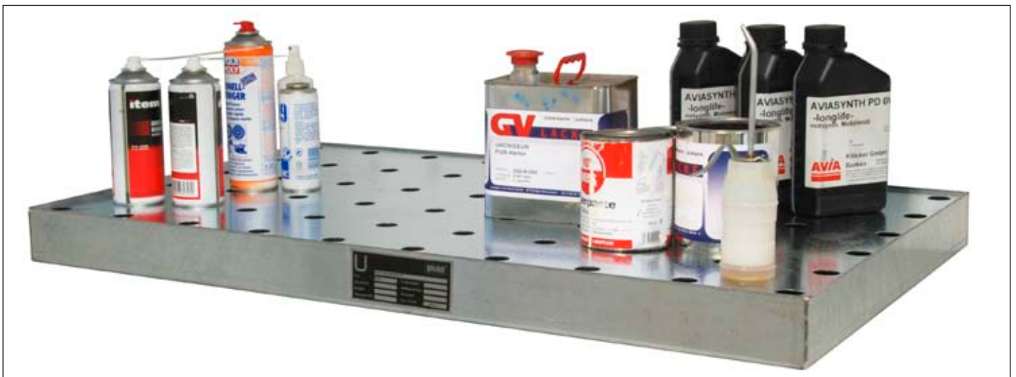
Typ KGW mit Lochblech-Rost