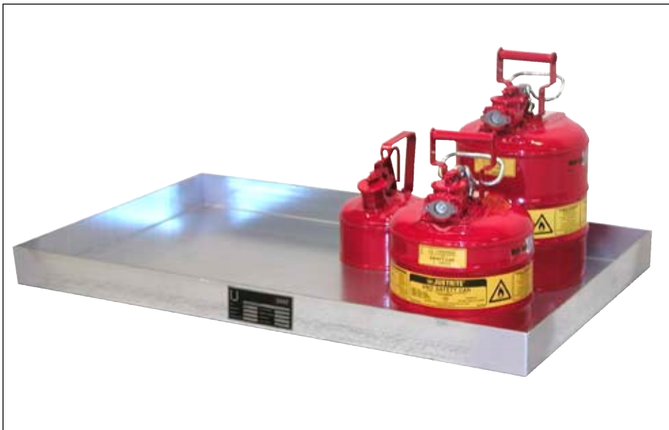
Typ KGW verzinkt