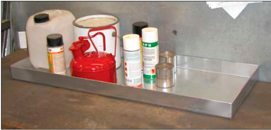
Typ KGW verzinkt auf einer Werkbank