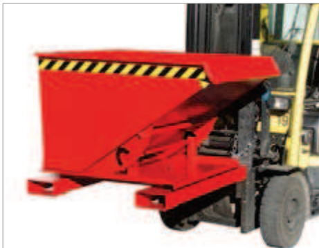
Typ 3S, Kipprichtung nach links