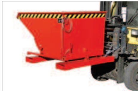
Typ 3S, Kipprichtung nach rechts