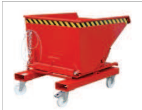
Typ S3S (siehe Seite 28) mit Rollen