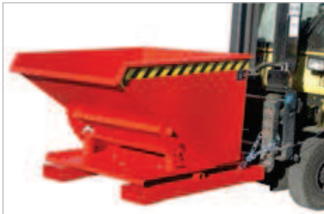
Typ 3S, Kipprichtung nach vorne