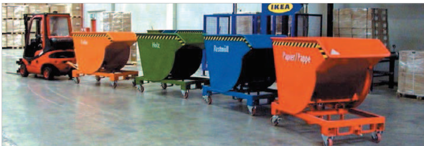
Typ BKM mit Rollen und Anhängervorrichtung mit Deichsel