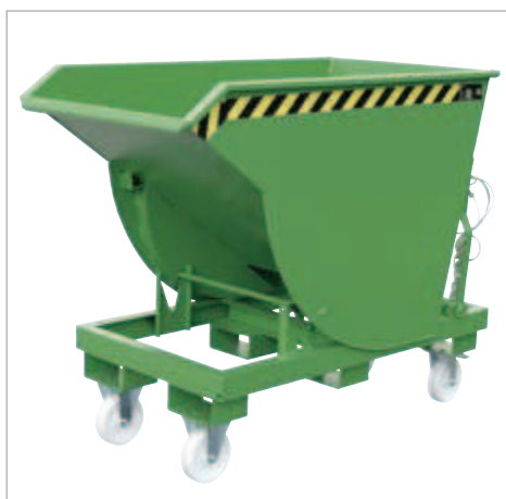
Typ BKM mit Rollen