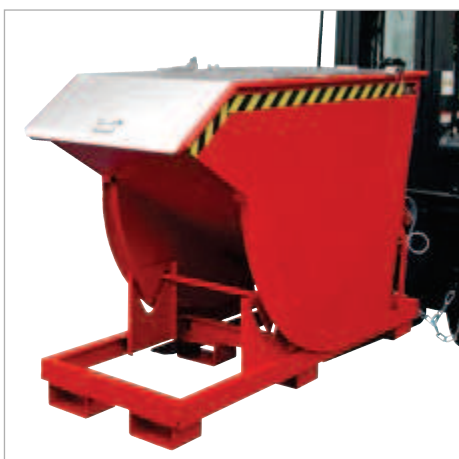
Typ BKM mit Deckel