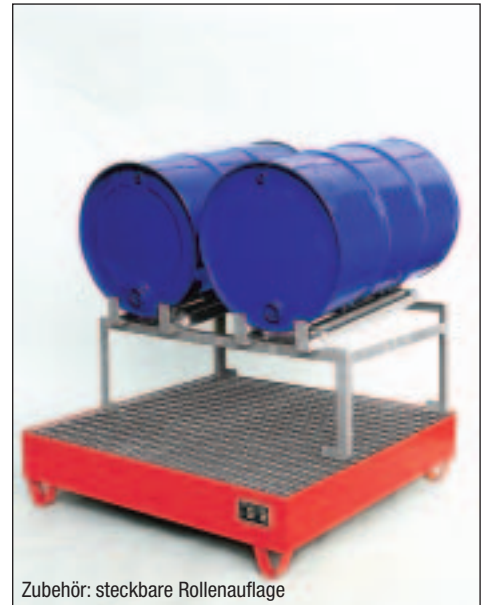
Typ Wannenmaße (LxBxH mm) 2034 lack. 1200 x 1200 x 285 2035 verz.