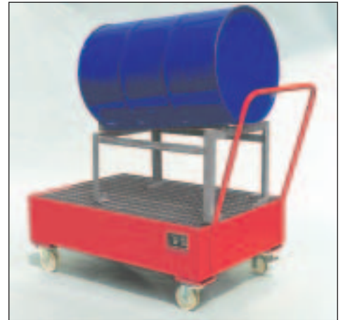
Typ Wannenmaße (LxBxH mm) 2024 lack. 1200 x 800 x 445 2025 verz.