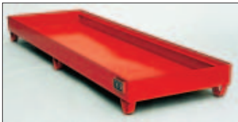
Typ Wannenmaße (LxBxH mm) 2040 lack. 2400 x 800 x 250 2041 verz.