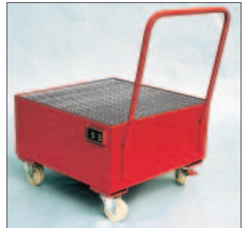
Typ Wannenmaße (LxBxH mm) 2004 lack. 800 x 800 x 550 2005 verz.