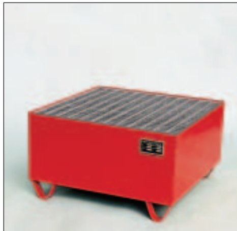
Typ Wannenmaße (LxBxH mm) 2002 lack. 800 x 800 x 465 2003 verz.