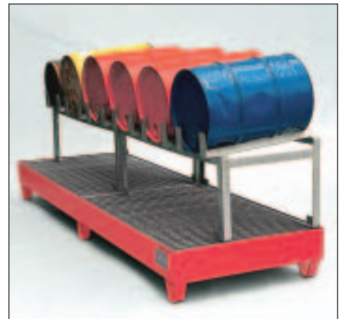
Typ Wannenmaße (LxBxH mm) 2044 lack. 2400 x 800 x 250 2045 verz.