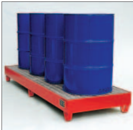
Typ Wannenmaße (LxBxH mm) 2042 lack. 2400 x 800 x 250 2043 verz.