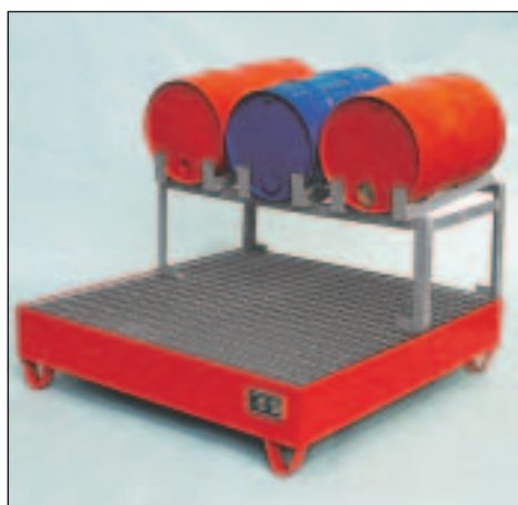
Typ Wannenmaße (LxBxH mm) 2036 lack. 1200 x 1200 x 285 2037 verz.