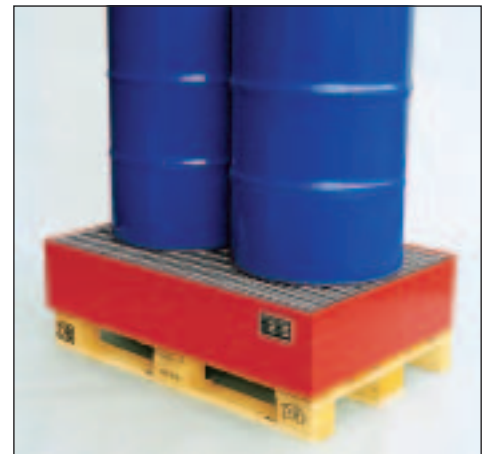
Typ Wannenmaße (LxBxH mm) 2010 lack. 1200 x 800 x 260 2011 verz.