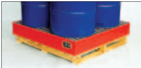
Typ Wannenmaße (LxBxH mm) 2028 lack. 1200 x 1200 x 185 2029 verz.