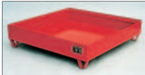
Typ Wannenmaße (LxBxH mm) 2030 lack. 1200 x 1200 x 285 2031 verz.