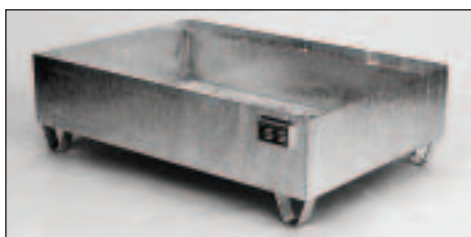
Typ Wannenmaße (LxBxH mm) 2016 lack. 1200 x 800 x 360 2017 verz.