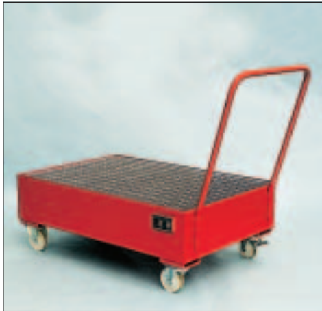
Typ Wannenmaße (LxBxH mm) 2020 lack. 1200 x 800 x 445 2021 verz.