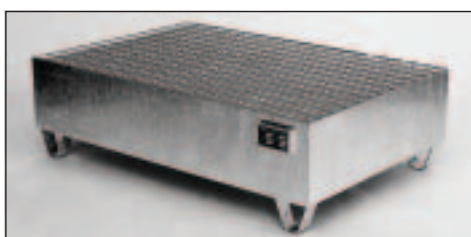
Typ Wannenmaße (LxBxH mm) 2018 lack. 1200 x 800 x 360 2019 verz.