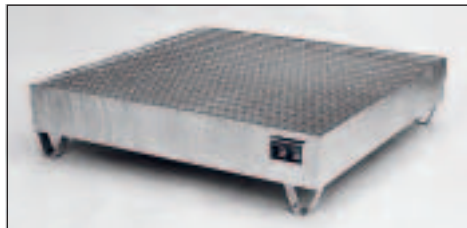
Typ Wannenmaße (LxBxH mm) 2032 lack. 1200 x 1200 x 285 2033 verz.