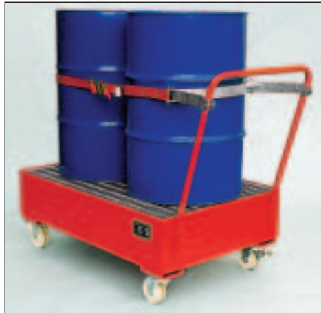
Typ Wannenmaße (LxBxH mm) 2022 lack. 1200 x 800 x 445 2023 verz.