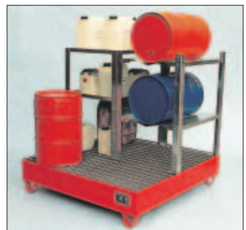
Typ Wannenmaße (LxBxH mm) 2038 lack. 1200 x 1200 x 285 2039 verz.