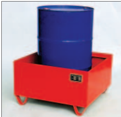
Typ Wannenmaße (LxBxH mm) 2000 lack. 800 x 800 x 465 2001 verz.