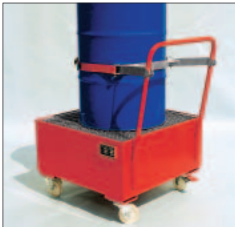
Typ Wannenmaße (LxBxH mm) 2006 lack. 800 x 800 x 550 2007 verz.