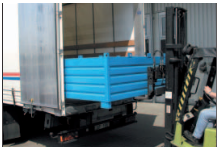
Optimale Ausnutzung der Ladefläche