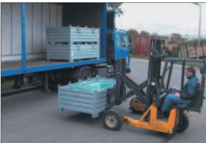
einsetzbar z.B. für die Sammlung von Flachglas