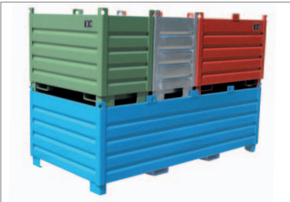
Typ SBS, untereinander stapelbar